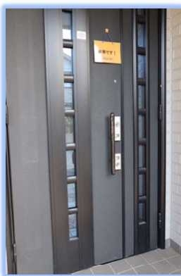
このように玄関に掲示してください

参加出来なかった方も、防災マニュアル等、今一度ご確認ください。 皆様、ご協力どうぞよろしくお願いいたします。