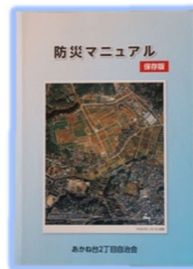
あかね台2丁目防災マニュアル