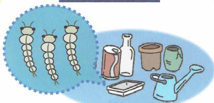
蚊の幼虫の発生源